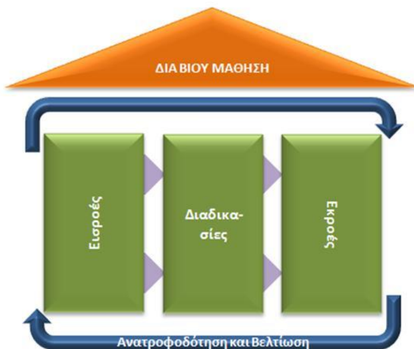
Σχήμα 1. Το οικοδόμημα της Διά Βίου Μάθησης

Θεμέλιο του οικοδομήματος αυτού είναι η ανατροφοδότηση και η διαρκής βελτίωση, η οποία εξασφαλίζει την αειφορία του συστήματος και διαμορφώνεται βάσει του πλαισίου διασφάλισης της ποιότητας στη διά βίου μάθηση – του πλαισίου π 3 .